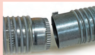
Raccordement aux flexibles pré-montés avec serrage rapide