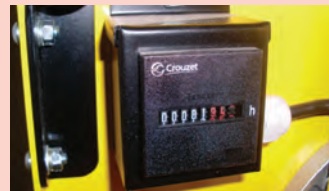
Compteur horaire d'utilisation