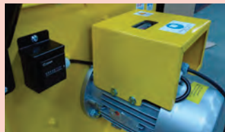
Puissance 2,2 kWh