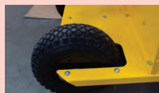
Roues gonflables crantées