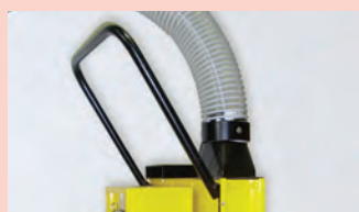
Poignée plus ergonomique